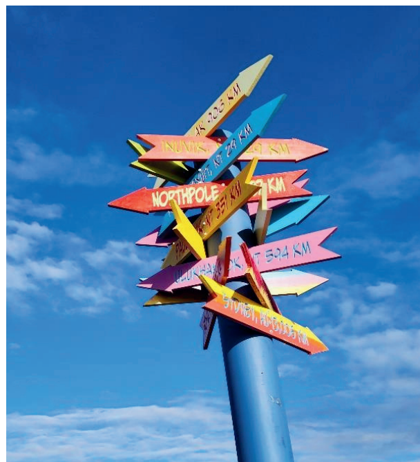
Photos de la région d'Inuvik