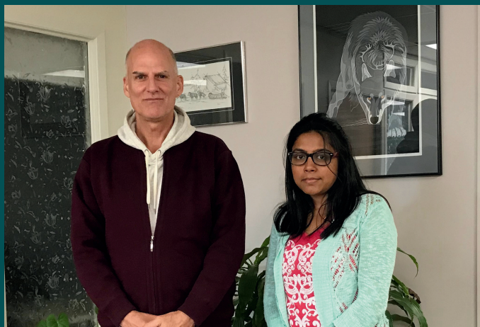
Instructeur et apprenante à Yellowknife, TN-O