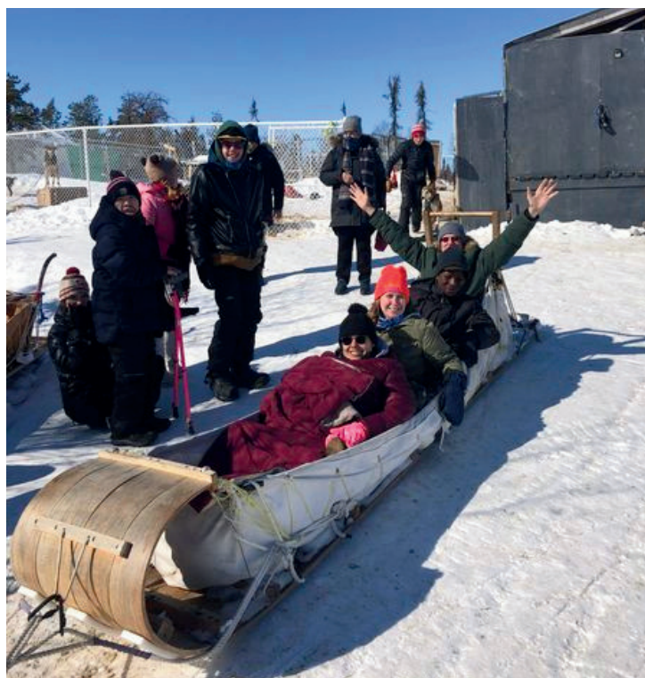
Créer des liens dans la communauté à Yellowknife, TN-O

La culture, l'histoire et la géographie locales influencent l'éducation, la formation et la situation d'emploi. Par conséquent, les solutions d'apprentissage mises en place dans les régions du Nord doivent être accessibles et culturellement adaptées. Les personnes qui éprouvent des difficultés en matière de littératie ou avec d'autres compétences fondamentales peinent plus que d'autres à accéder à de l'aide et à des possibilités d'avancement. C'est encore plus difficile dans le Nord où les organismes et professionnels qualifiés pour aider les apprenant·e·s adultes à atteindre leurs objectifs sont plus rares. Les coûts opérationnels élevés et la pénurie de logements dans la région s'ajoutent aux défis.