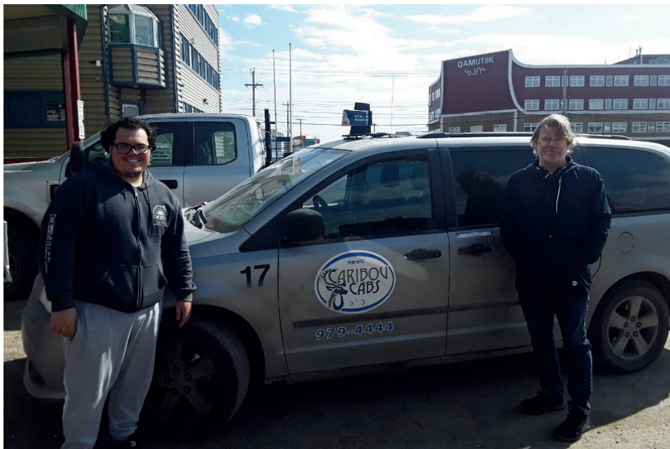
Amélioration des compétences linguistiques et liées à l'emploi sur le lieu de travail avec un conducteur de Caribou Cabs

Littératie Ensemble a offert des programmes centrés sur l'étudiant·e et culturellement adaptés aux circonstances dans la collectivité et des apprenant·e·s. Les instructeurs·trices n'ont ménagé aucun effort pour aider les apprenant·e·s à atteindre leurs objectifs. Entre autres, ils·elles les ont accompagné·e·s sur le lieu de travail pour s'adapter à leur horaire. Ils·elles ont aussi offert des cours le soir et les fins de semaine. Enfin, ils·elles ont agi comme « ami·e » pour aider les apprenant·e·s dans des situations difficiles (p. ex. aller à la banque pour ouvrir un compte). Cet engagement témoigne de notre philosophie fondatrice: « tout lieu peut être un lieu d'apprentissage »!