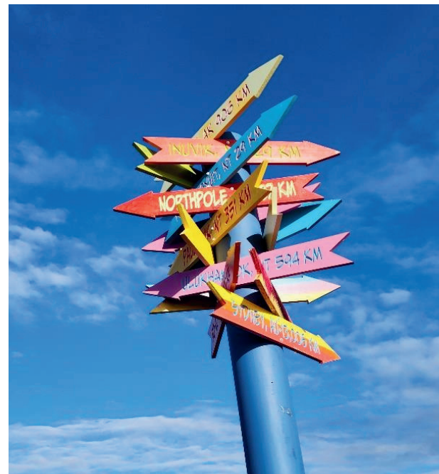
Photos de la région d'Inuvik