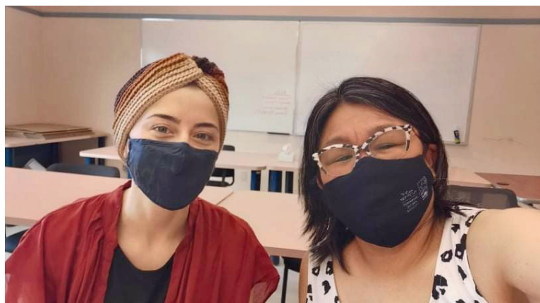
Séance de tutorat – Iqaluit, NU

Les principales industries à Prince George et dans les environs sont la construction, le secteur manufacturier, la foresterie, les services professionnels, et le transport et l'entreposage. Les principales industries dans la région de Burns Lake sont la foresterie/les scieries, le tourisme et l'industrie minière (avec navette). Nous avons commencé à offrir un programme d'alphabétisation pour aider les minieur·euse·s à Burns Lake. Toutefois, en raison de restrictions liées à la COVID19, nous n'étions pas en mesure de déployer le programme comme prévu. C'est pourquoi nous l'avons élargi pour l'offrir à Prince George. Cette ville est plus grande, compte plus d'industries et a une plus grande demande de main-d'œuvre.