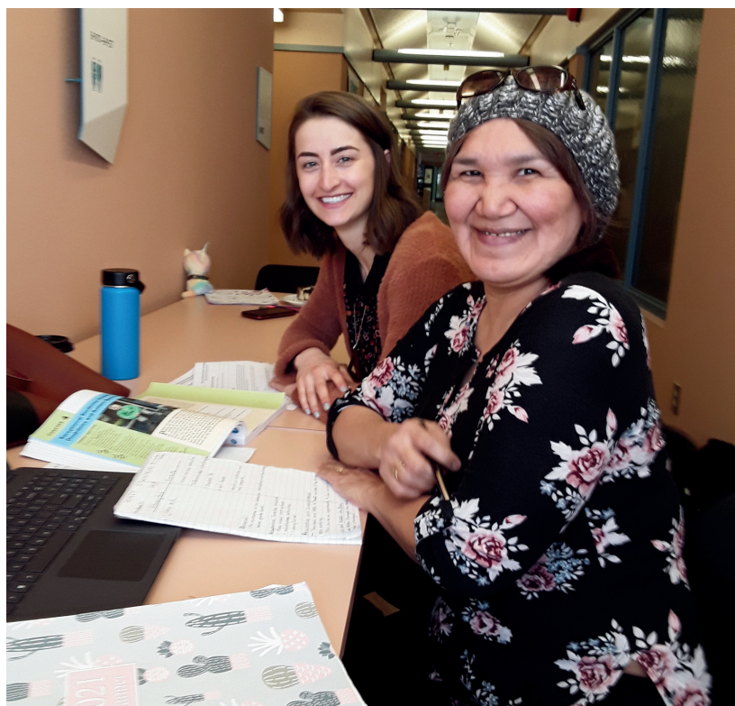
Séance de tutorat – Iqaluit, NU